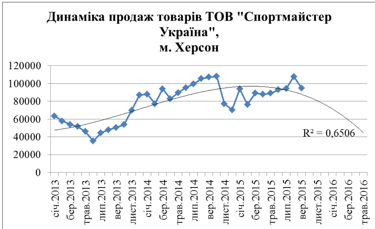
Рис. 3.3. Динаміка продаж товарів ТОВ «Спортмайстер Україна», м.Херсон

Посилання на ілюстрації розміщують у вигляді виразу в округлих дужках «(рис. 3.1.)» або зворот типу: «...як це видно з рис.3.1.», або «...як показано на рис. 3.1.».