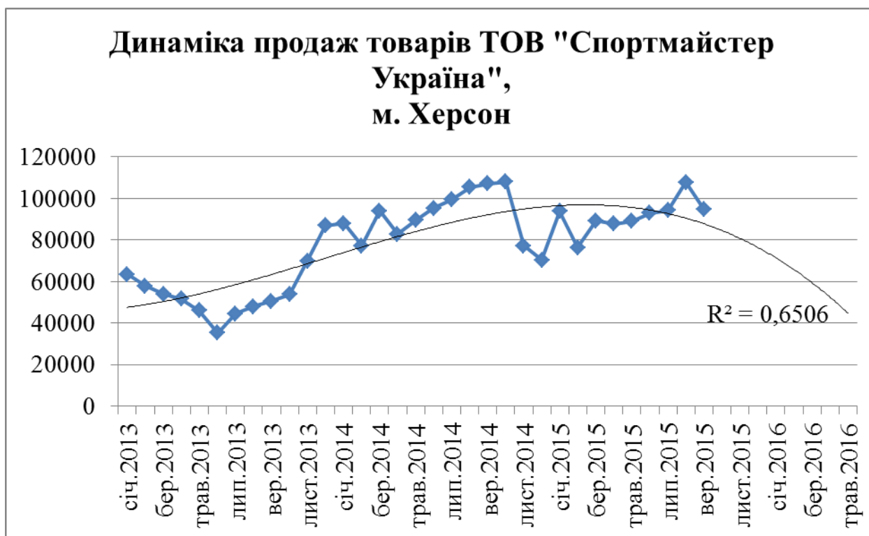
Рис. 3.3. Динаміка продаж товарів ТОВ «Спортмайстер Україна», м.Херсон

Посилання на ілюстрації розміщують у вигляді виразу в округлих дужках «(рис. 3.1.)» або зворот типу: «...як це видно з рис.3.1.», або «...як показано на рис. 3.1.».